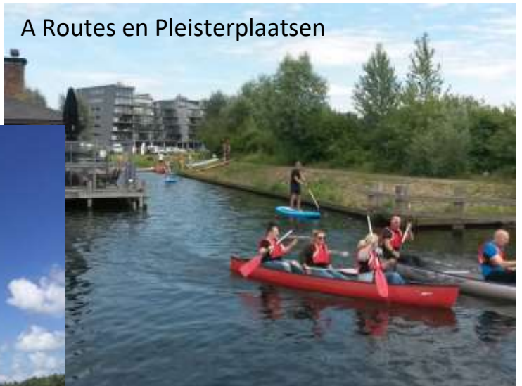
A Routes en Pleisterplaatsen