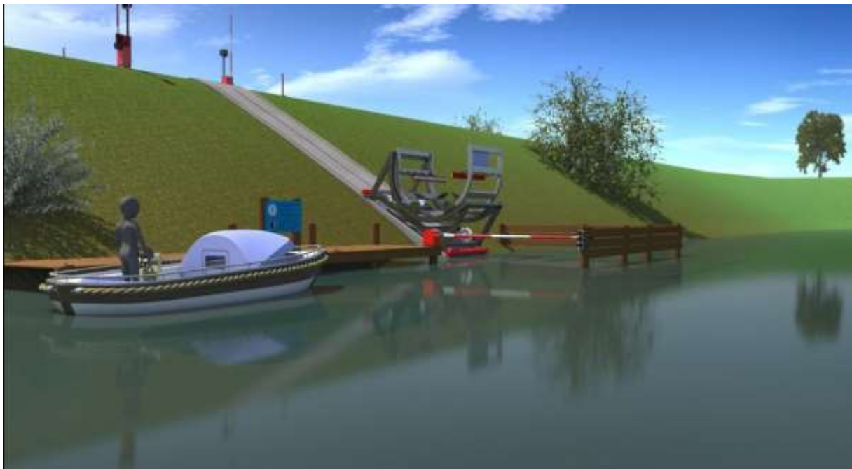
Voorbeeld van een Zelfbedieningsovertoom voor sloepen, BRTN categorie F in Spakenburg (ontsluiting Laakzone/Vathorst naar het Nijkerkernauw)n. Afbeelding: Waterrecreatie Advies

In de planperiode van het Waterplan (tot 2022) moet het routen netwerk verder worden uitgewerkt. Dit sluit aan bij de plannen van het Waterschap om voor 2022 het achterstallig onderhoud te hebben weggewerkt en overeenstemming te hebben bereikt over waterplantvrije zones. Ook wijst het Waterplan op het belang om vanaf de eerste planfase aan te sturen op integrale keuzes voor de waterstructuur (bijvoorbeeld ook ecologie) en samenhang met de bebouwde omgeving zoals afwatering, brughogtes en aanlegsteigers.